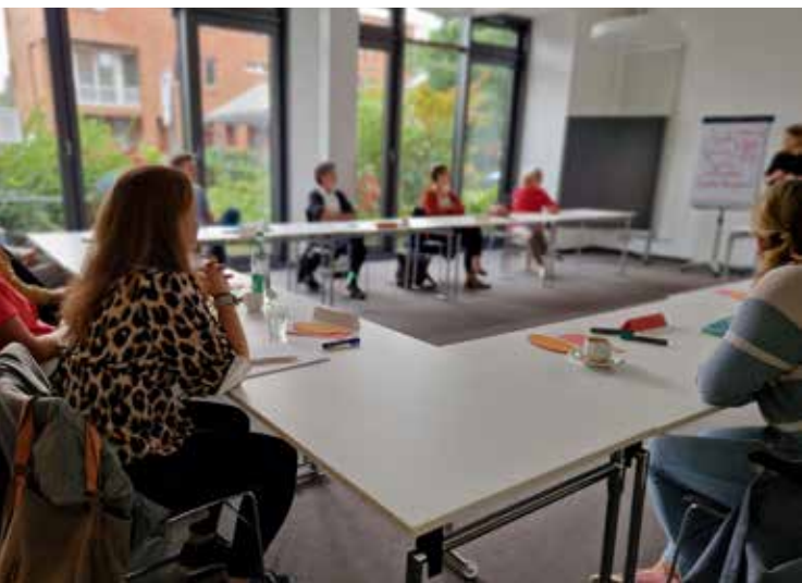
Die Arbeitskreise treffen sich z. B. im Raum Pavillon.

Etwa die Hälfte der rund 200 Mitgliedsorganisationen arbeitet in einem oder in mehreren Arbeitskreisen mit. Aktive Fachbereiche gibt es in den mitgliederstärksten Arbeitsfeldern: Armut und Sozialhilfe, Altenhilfe und Pflege, Teilhabe/Sozialpsychiatrie und Kinder- und Jugendhilfe. Quer zu den zielgruppenspezifischen Facharbeitskreisen gibt es noch den Arbeitskreis Entgelte/Pflegesätze für alle pflegesatzfinanzierten Einrichtungen.