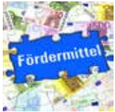
Anträge und Fördermittel